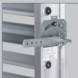
Feststellvorrichtung an JZ-AL, JZ-HL-AL