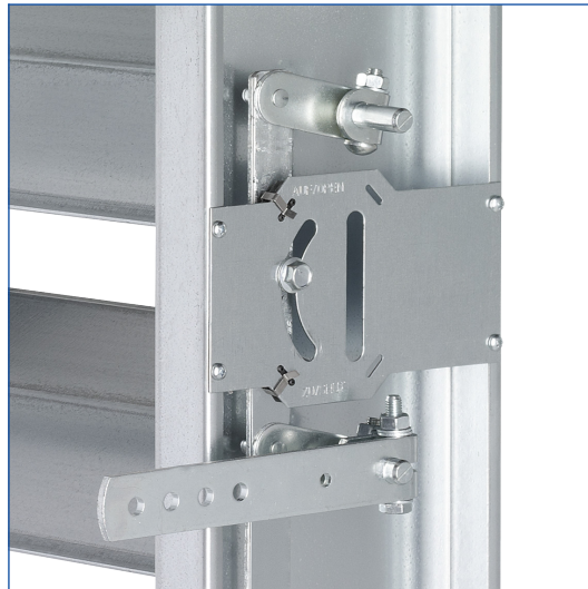
Die Feststellvorrichtung befindet sich immer zwischen der ersten und zweiten Lamelle von oben