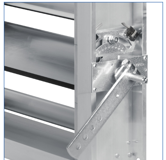
Die Feststellvorrichtung befindet sich auf der ersten Lamelle von oben (Klappen bis drei Lamellen) oder auf der dritten Lamelle von oben (Klappen ab vier Lamellen)