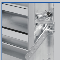
Feststellvorrichtung mit zwei Endschaltern an JZ-LL-AL