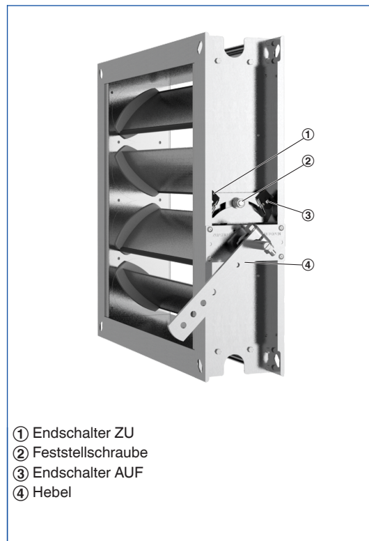
Schematische Darstellung Feststellvorrichtung und Endschalter (Jalousieklappen aus Aluminium)