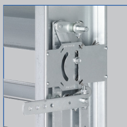
Feststellvorrichtung und Endschalter an JZ-S, JZ-S-A2, JZ-LL, JZ-HL, JZ-LL-A2