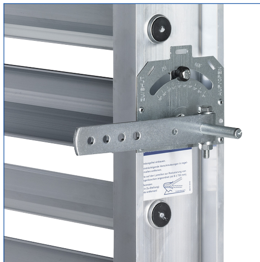
Die Feststellvorrichtung befindet sich auf der ersten Lamelle von oben (Klappen bis drei Lamellen) oder auf der dritten Lamelle von oben (Klappen ab vier Lamellen)