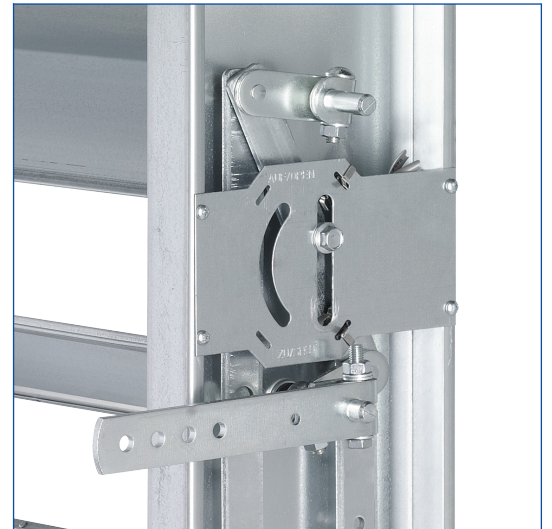
Die Feststellvorrichtung befindet sich immer zwischen der ersten und zweiten Lamelle von oben