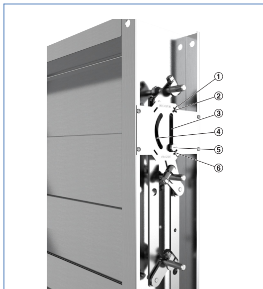
Schematische Darstellung Feststellvorrichtung und Endschalter (Jalousieklappen aus Stahl)